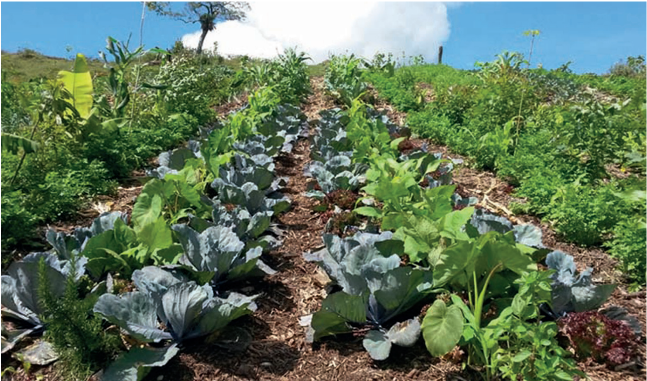
Figura 4. Plantio sucessional de hortaliças com foco em produção de rúcula, alface roxo, repolho roxo e batata yacon (no centro) e espécies arbóreas (nas laterais) 30 dias após a implantação.