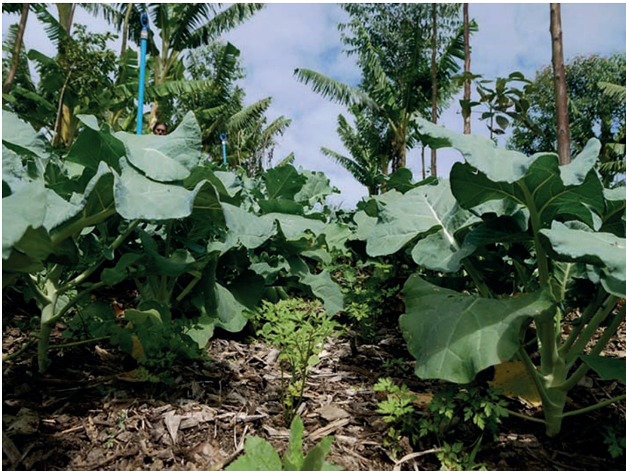
Figura 2. Poda drástica de árvores e bananeiras viabilizam replantio de hortaliças entre as linhas de árvores. Consórcios estratificados de hortaliças com ciclos de colheita escalonados incrementam a produtividade do SAF em um sistema produtivo que conta com a presença de diversos grupos funcionais. Sítio Florbela. Florianópolis/SC.

A presença de plantas com atributos funcionais diversificados em um mesmo espaço contribui para aumentar a complexidade (Figura 2).