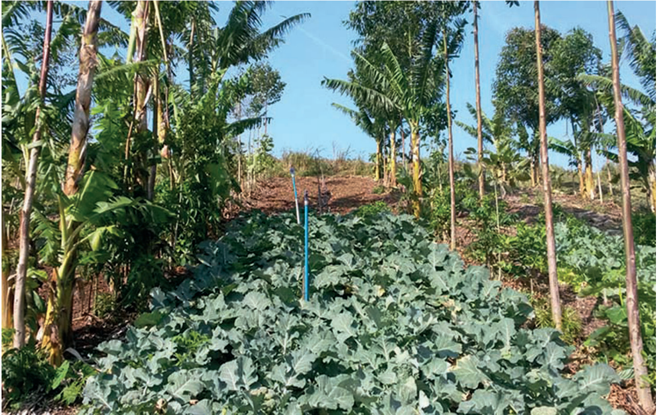
Figura 6. Mesmo SAF da Figura 5, quatorze meses após a implantação do SAF, no centro da imagem plantio de hortaliças estabelecido após a poda e incorporação de biomassa das espécies arbóreas.

Árvores como garapuvu ( Schizolobium parahyba ), eucalipto ( Eucalyptus grandis ), gliricídia ( Gliricidia sepium ), grandiuva ( Trema micrantha ) e licurana ( Hyeronima alchorneoides ) são exemplos de espécies que podem ser usadas nas linhas entre os canteiros. O espaço entre as árvores pode ser aproveitado para o plantio de bananeiras, feijão guandu ( Cajanus cajan ) ou outras espécies com porte médio que irão enriquecer a biomassa juntamente com o capim produzido em faixas (discutido mais adiante). A biomassa produzida pela poda das espécies arbóreas, pelo corte das bananeiras e por arbustos juntamente com a biomassa produzida nas faixas de capins, faz com que o SAF tenha uma biomassa altamente diversificada, com materiais com diferentes teores de lignina e diferentes ritmos de decomposição. O volume de biomassa produzida mantém o solo coberto permanentemente e favorece a manutenção constante de nichos ecológicos, mantendo a biodiversidade de micro e mesofauna.