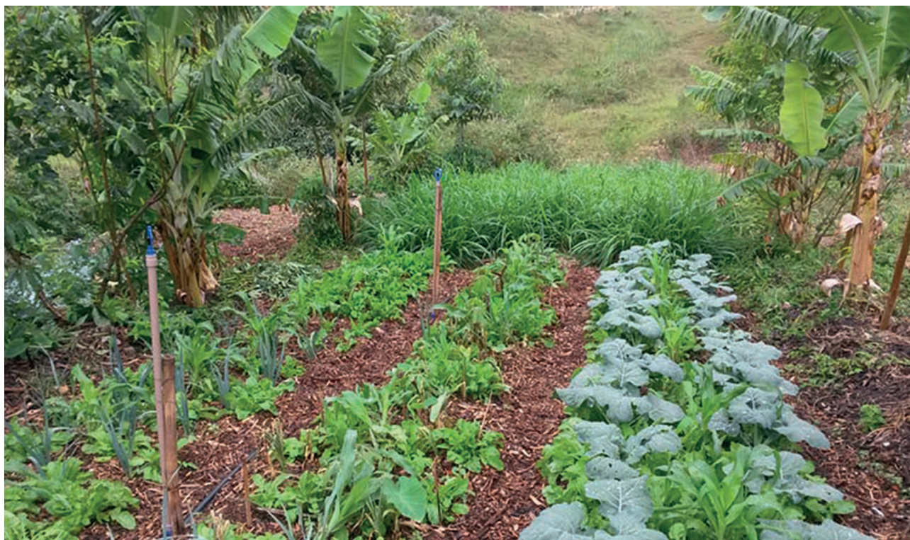
Figura 7. A faixa de capim como mombaça ( Panicum maximum cv. Mombaça ) entre linhas arbóreas jovens (no fundo) pode ser roçado até 5 vezes por ano e adubar as linhas de árvores ou hortaliças próximas enquanto as árvores ainda não produzem suficiente biomassa. Sítio Florbela. Florianópolis/SC.

As plantas apresentam respostas fisiológicas aos estímulos do ambiente, portanto, desenhar o SAF de modo a favorecer o desenvolvimento da planta com estímulos que tornem o ambiente mais confortável para a mesma é uma estratégia fundamental para aumentar a eficiência do SAF (GLIESSMAN, 2000). As modificações na umida-