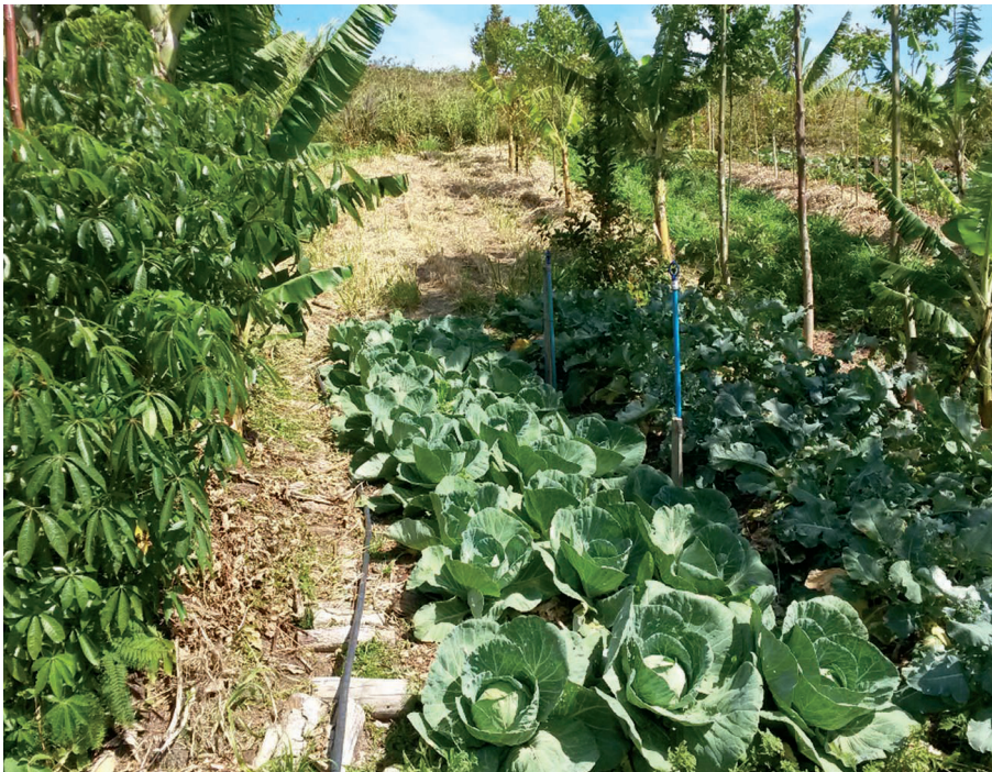
Figura 8. A sombra migra rapidamente entre canteiros de hortaliças durante o dia porque apenas a ponta da copa das árvores dominantes é poupada nas podas drásticas (eucaliptos na superior direita e margem esquerda). Fustes podados e desbastados são picados e encostados diretamente no solo mineral sobre caminhos (centro-esquerda da foto). Semeadura direta de outras espécies arbóreas tolerantes à poda como paineira ( Chorisia speciosa , na margem esquerda) na linha das árvores perpetua a adubação verde lenhosa para além da colheita de fustes dos eucaliptos. Sítio Florbela. Florianópolis/SC.