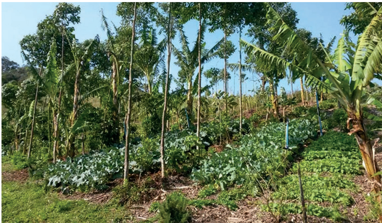
Figura 1. Sistema Agroflorestal (SAF) com canteiros de hortaliças intercaladas entre linhas perenes para adubação verde, inicialmente dominadas por bananeiras e árvores tolerantes a podas drásticas dos galhos laterais que criam uma sombra filtrada e um microclima ameno para as hortaliças durante o verão. Sítio Florbela. Florianópolis/SC.

Portanto, incorporar os princípios e práticas agroflorestais ao SPDH tem potencial para torná-lo mais eficiente, produtivo e sustentável em função da aplicação de técnicas de manejo pautadas pela ecologia. Neste sentido, a sucessão agroflorestal representa um empurrão na transição agroecológica da horticultura para uma