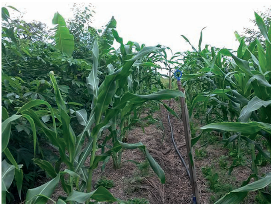
Figura 3. Milho, eucalipto, mandioca, plantas com diferentes atributos funcionais ocupando o mesmo espaço.

funcionais das plantas a serem consorciadas, procurando combinar plantas com diferentes atributos funcionais (Figura 3) e ocupar os diferentes estratos de maneira complementar, desde que se leve em consideração o ciclo de vida e o ritmo de crescimento das plantas, ou seja, a sucessão. Na prática as plantas a serem inseridas no SAF são reunidas em função dos seus atributos em grupos funcionais, com a finalidade de aumentar a diversidade funcional em função do número de grupos funcionais. Além disso, o número de indivíduos de cada grupo deve ser pensado de modo a estabelecer uma proporção entre os grupos, evitando-se desequilíbrios na proporção do efeito que cada grupo tem sobre o ambiente.