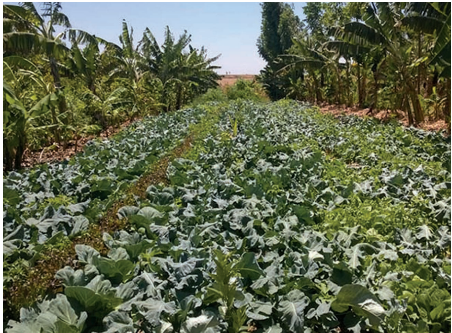
Figura 9. Produção de hortaliças em sucessão agroflorestal em escala comercial. Sítio Semente/DF: www.sitiosemente.com .

Outro ponto que dificulta aos agricultores agrofloresteiros é o desincentivo para a comercialização de alimentos sazonais da região, pois